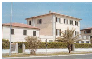
Villa Freschi Ronchi di Massa