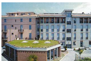
Villa Gioiosa Diano Marina

ALBERGHI E CASE PER FERIE PER VACANZE ESTIVE E INVERNALI