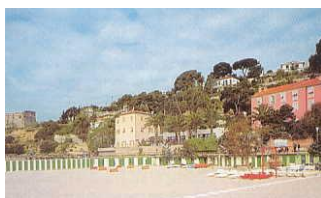
Villa Sacra Famiglia Arma di Taggia